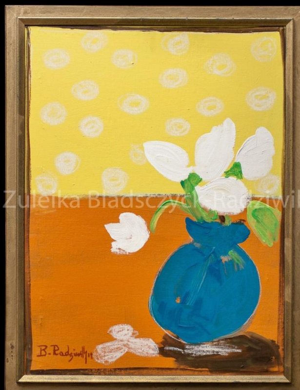
Bouquet de magnolias – 2019 – 80x60 cm