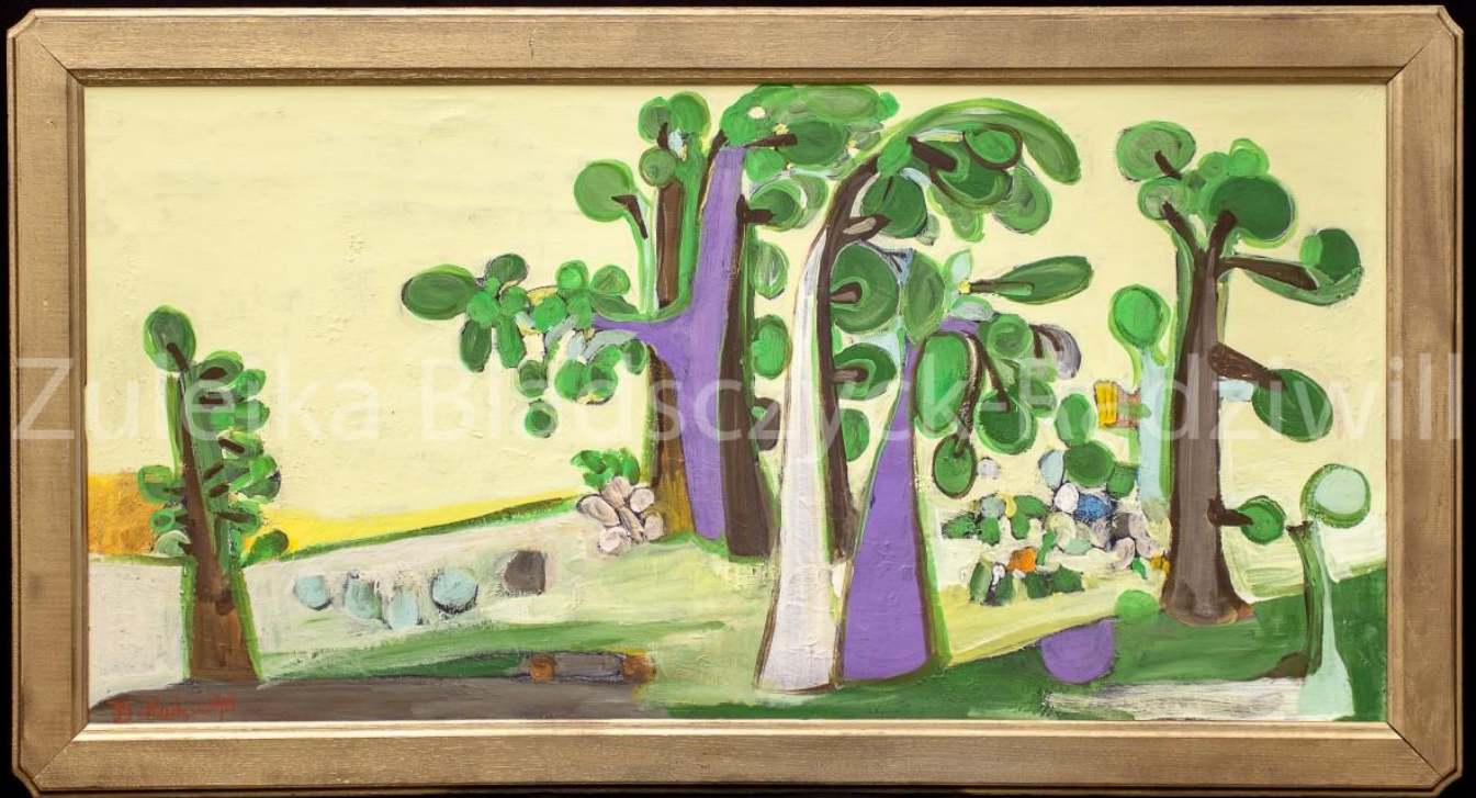
Paysage X - 2019 – 160x60 cm