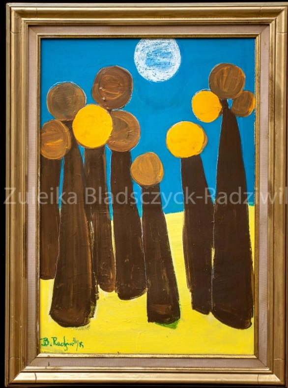
Clair de lune – 2019 – 50x70 cm