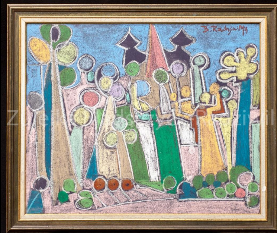
Paysage XIII - 2019 – 160x60 cm