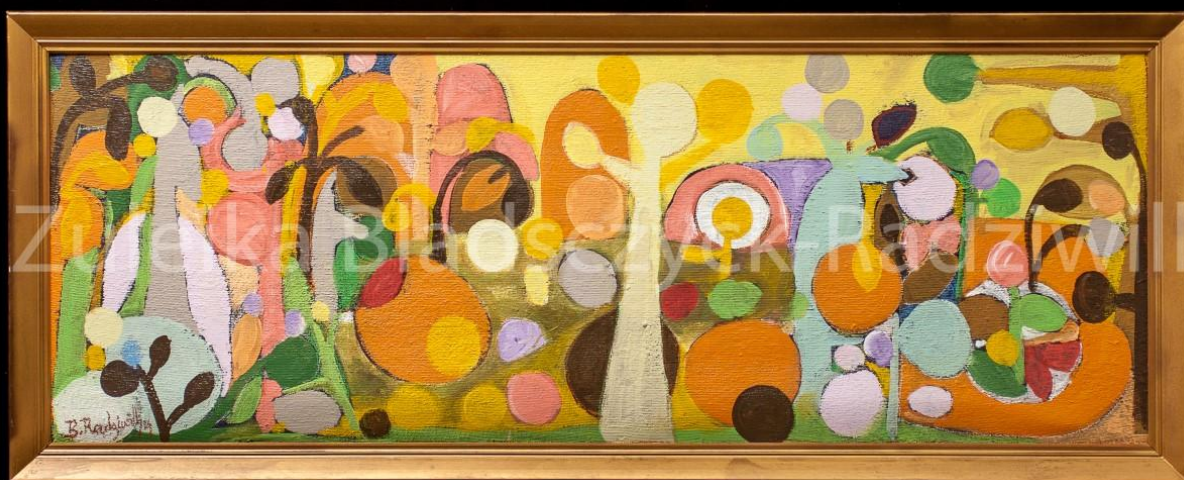
L'automne – Bladscyck-Radziwill 2019 – 160x60 cm