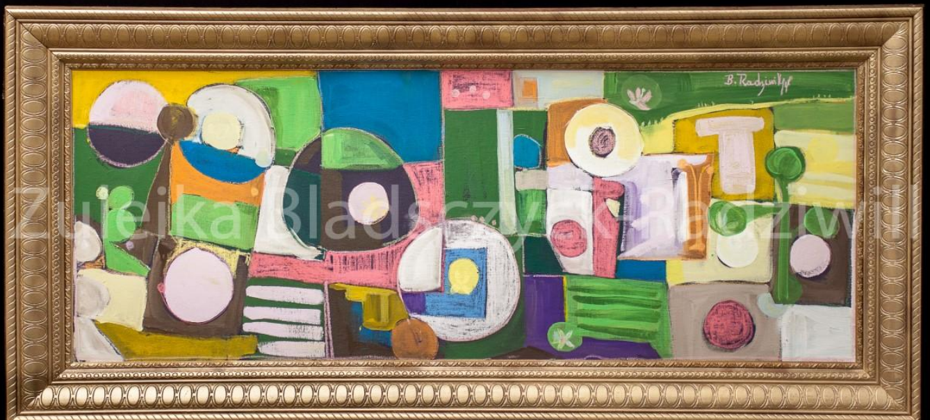
Le printemps – 2019 – 160x60 cm