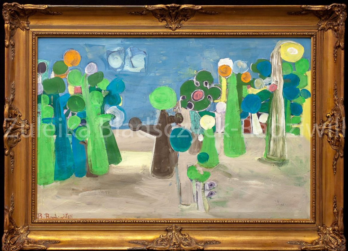
Paysage XIV - 2019 – 90x60 cm